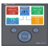
Panou de control Color GX